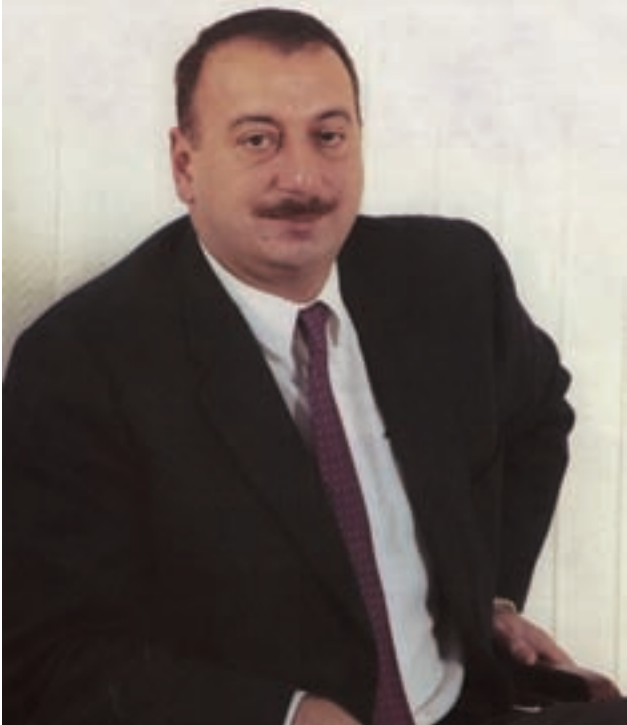
Azərbaycan Respublikasının Prezidenti, Atatürk Mərkəzinin fəxri sədri İlham Əliyev