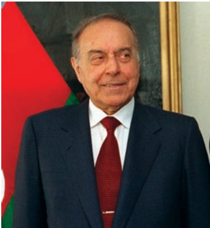
Azərbaycan xalqının ümummilli lideri, Atatürk Mərkəzinin qurucusu Heydər Əliyev