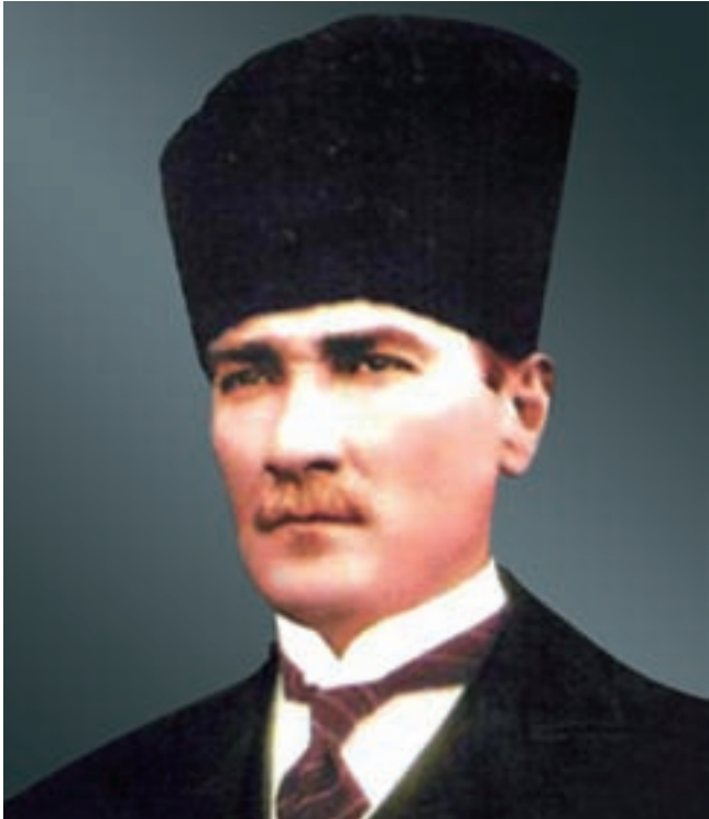
Türkiyə Cümhuriyyətinin qurucusu Mustafa Kamal Paşa Atatürk